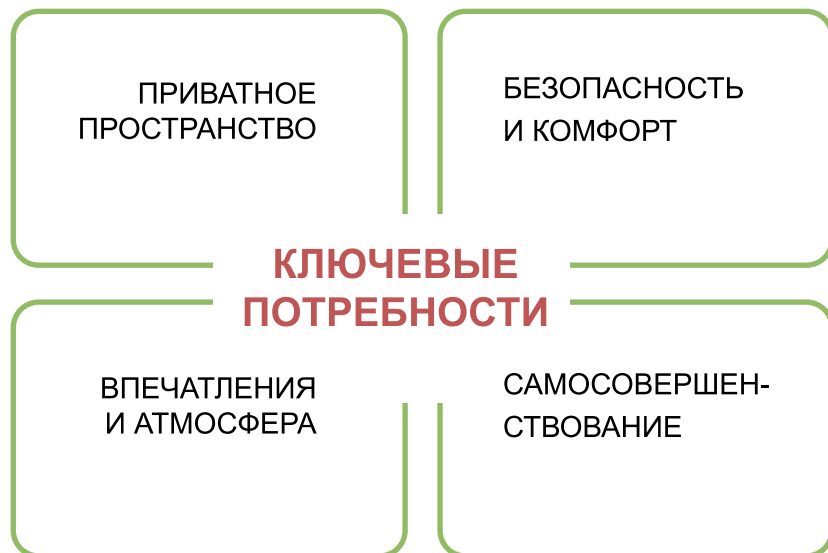
Рис. 1. Ключевые потребности подростков и молодежи в сфере неформального образования

того, большое значение для респондентов имеет потребность в новых впечатлениях и свежей, вдохновляющей «атмосфере» неформального образования.