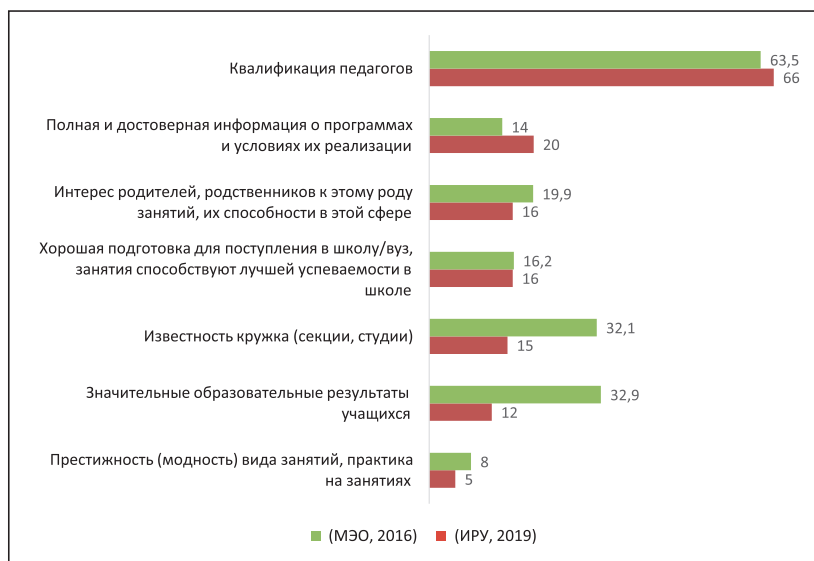
Рис. 2. Распределение ответов на вопрос: «Какие обстоятельства вы прежде всего принимали во внимание при выборе кружка (секции, студии)?»

го процесса. Здесь для московских родителей, как, впрочем, и для представителей других регионов, на первом месте квалификация педагогических работников – 66 %. Для москвичей (20 %) значительно больше, чем в среднем по России (14 %), оказывается важна информационная прозрачность.