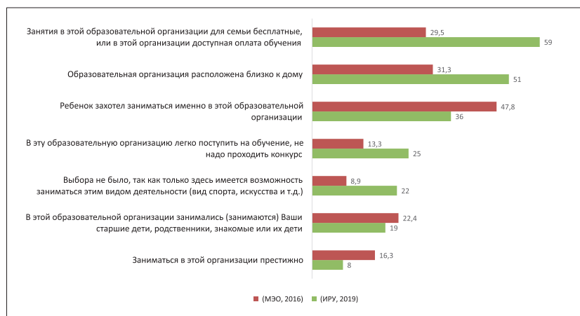
Рис. 1. Распределение ответов на вопрос «По каким причинам вы выбрали данную организацию дополнительного образования?»

Четче всего просматриваются два требования московских родителей – доступность оплаты (бесплатность) и территориальная доступность. Кроме того, для москвичей больше, чем в среднем для россиян, важны отсутствие отбора детей в кружок и наличие актуальной образовательной программы. В оценке дополнительного образования активные московские родители больше доверяют себе, чем желанию ребенка (если сравнивать со средними показателями по стране) (рис. 1).