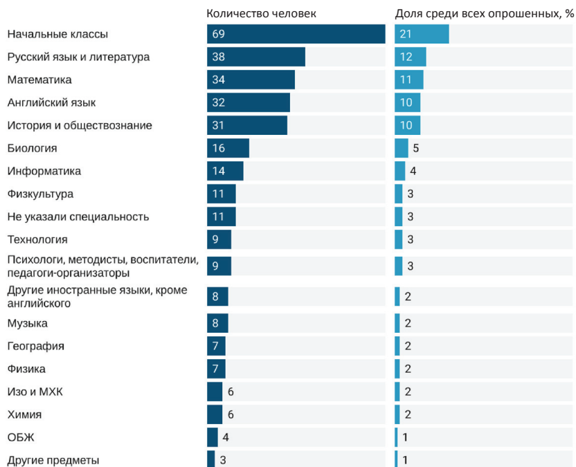
Рис. 1. Участники анкетирования учителей по педагогическим специальностям

отметить, что 57 % респондентов используют возможности городской среды для самообразования. Таким образом, мы видим, что учителя применяют различные формы привлечения городской среды в свою профессиональную деятельность: проводят организованные экскурсии, задают самостоятельную работу, а также пользуются городом как ресурсом для самообразования. Городские образовательные практики для большинства педагогов стали неотъемлемой частью образовательного процесса.