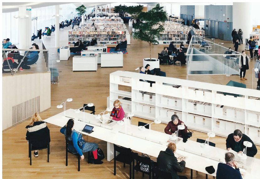
Библиотека Oodi в Хельсинки, автор И. Ивашина

Для современной библиотеки привлекательные архитектура и дизайн стали не признаком роскоши, а одним из основных способов существования. Именно за счет современных решений создается особая эстетика уважения и достоинства. Любой посетитель (а библиотеку чаще посещают люди среднего и низкого достатка) чувствует в таком месте заботу о себе, принимает как норму достойные условия жизни (речь не только о книгах, но и о хорошей мебели, технике, оборудовании).