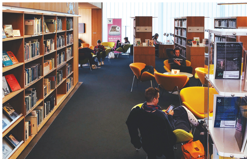
Библиотека города Турку

Для обслуживания клиентов у библиотеки есть специальное оборудование: удобные кассеты и